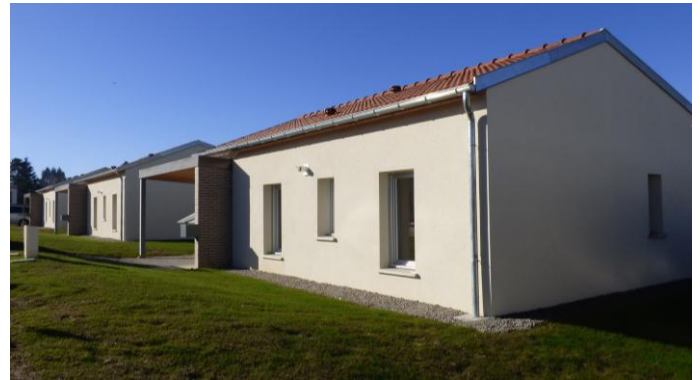
Pavillons individuels accession

Les premières misés en location et ventes ont été effectuées en mars 2025 .