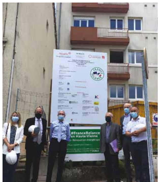
« Visite préfectorale du chantier de réhabilitation de la résidence Bas Chinchauvaud »

La réhabilitation de la résidence Bas Chinchauvaud, située dans le centre-ville de Limoges proche de la gare, en est un exemple concret : grâce aux aides financières octroyées par le plan France Relance, les 16 studios existants seront requalifiés en 8 appartements de type 3 (2 chambres). Des travaux conséquents engagés aussi bien dans les logements que dans les espaces communs et à l'extérieur de la résidence, grâce à une restructuration lourde couplée à une rénovation énergétique. Ces logements sont actuellement classés E selon le DPE. Ils atteindront l'étiquette B après travaux. Les travaux ont démarré en mars 2021 pour une livraison prévue en juin 2022. Avant de démarrer les travaux, les 12 locataires en place ont tous bénéficié d'un accompagnement personnalisé pour trouver la solution de logement la plus adaptée à leurs besoins au sein de notre patrimoine.