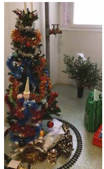
SOYAUX - Tour W2