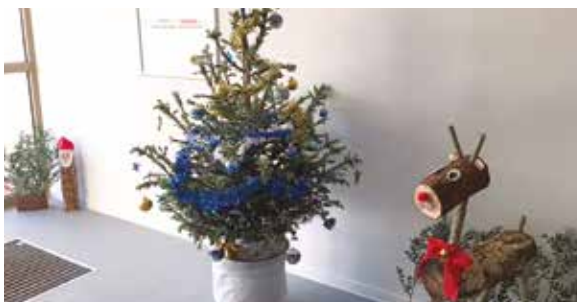
CHATEAUNEUF/CHARENTE - Champ de Fontaury

Chaque année, lorsque qu'arrive la période de Noël, gardiens, gardiennes et locataires décorent leurs halls d'immeuble pour vivre pleinement la magie de Noël ! Merci à vous toutes et tous pour ces initiatives qui font du bien ! Ci-dessous un petit retour en images.