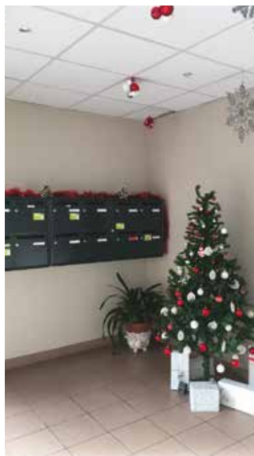
LIMOGES - Mauvendièrre 2