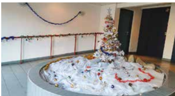
LIMOGES - De Lattre de Tassigny